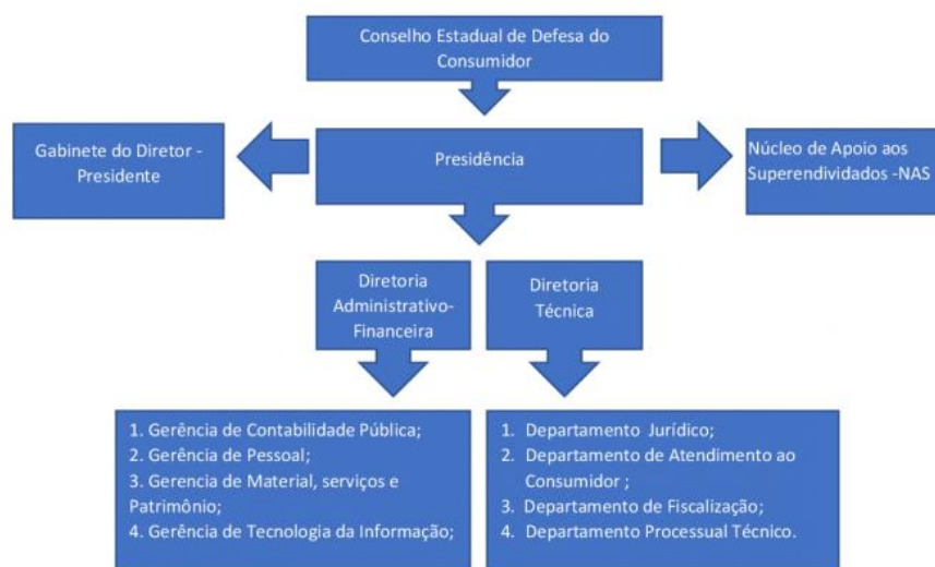
Estrutura Organizacional do Instituto de Defesa do Consumidor – PROCON / AM conforme Lei Delegada Nº 125, de 01 de novembro de 2019.