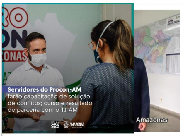
Servidores do Procon-AM farão capacitação de solução de conflitos; curso é resultado de parceria com o TJ-AM

Por ocasião da implementação do Centro Judiciário de Solução de Conflitos - CEJUSC PROCON, os servidores do PROCON/AM participaram do Curso de Formação de Mediadores e Conciliadores Judiciais, recebendo, ao final, certificação para atuarem como mediadores judiciais, de acordo com a Resolução N. 125/2010 do Conselho Nacional de Justiça – CNJ.